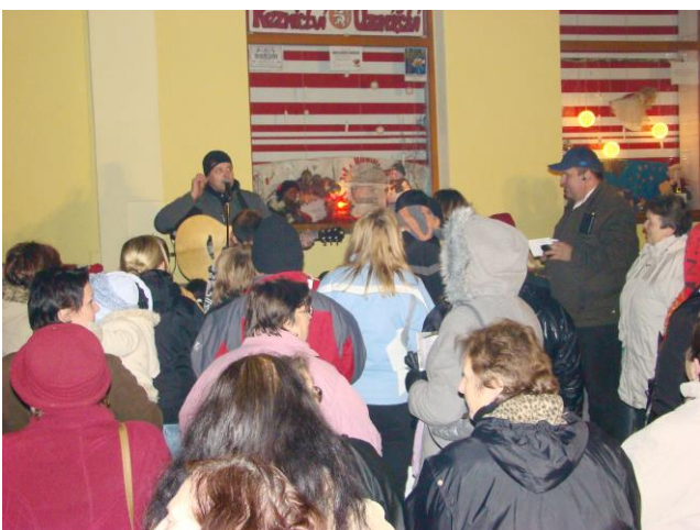
Vánoční zpívání koled