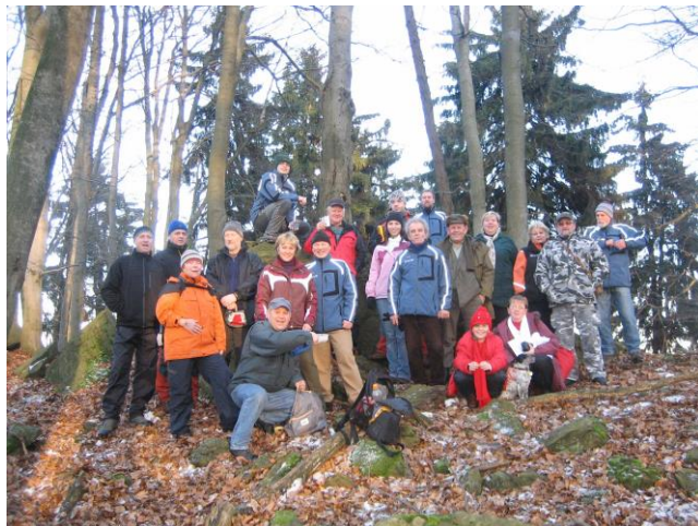
Vycházka s Niklem na Niklasberk