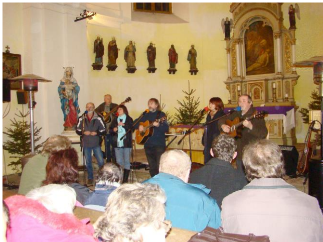
Vánoční koncert - Roháči

31. prosince jsme se společně rozloučili se starým rokem a přivítali nový . Na mostě přes Radbuzou, osvětleném svíčkami, se sešly na tři stovky účastníků tradičního setkání, aby sledovaly vypouštění „balonků štěstí“ a ohňostroje, které rozsvěcovaly oblohu na mnoha místech Bělé i v okolí.