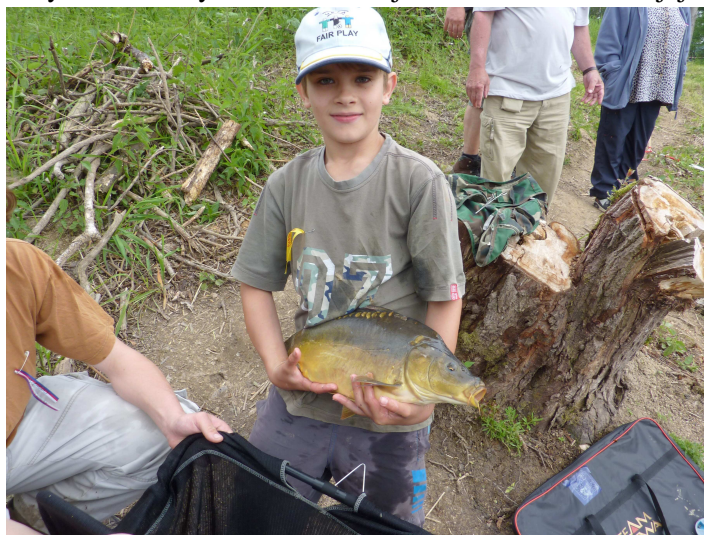
Nejmenší závodník s největší rybou

družstva: 1. Domažlice, 2. Tachov, 3. Plzeň-město